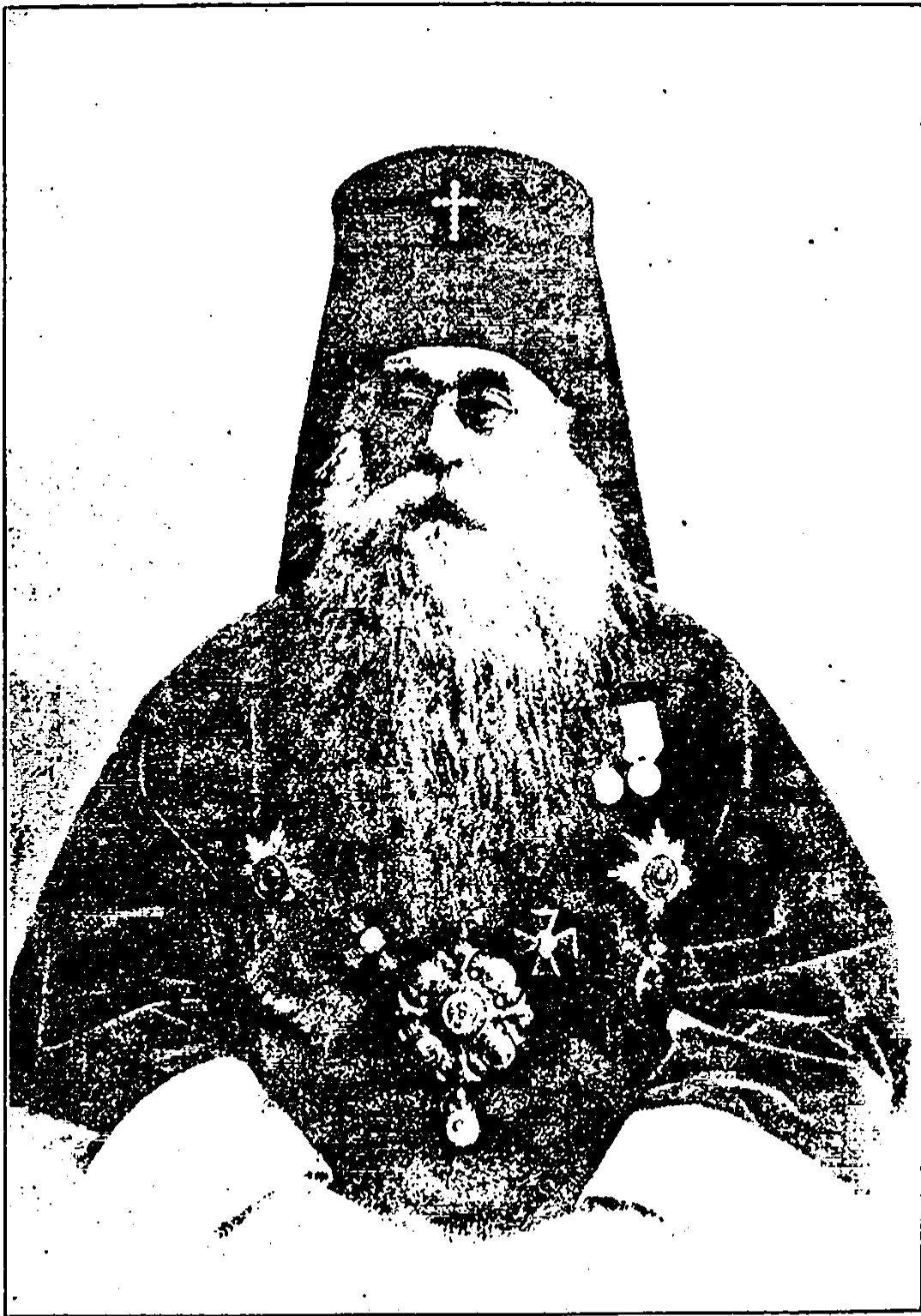
Высокопреосвященный Флавіанъ, Архієпископъ Харьковскій и Ахтырскій.